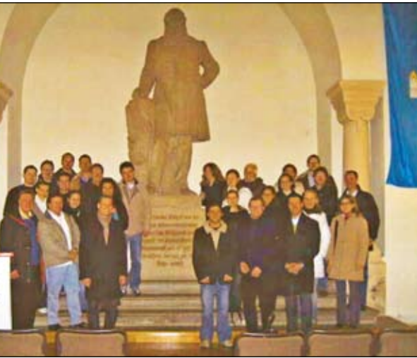
Die Spitze der Deutschen Turnerjugend in der Ehrenhalle

Die Begeisterung war bei einigen so groß, dass sie uns