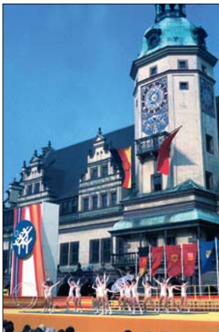
Turner vor dem alten Leipziger Rathaus

Das Programm: eine Woche lang Wettkämpfe, Großveranstaltungen, Sportlerbälle im „Zentralen Klub der Jugend“, eine Veranstaltung der FDJ „Weg mit dem NATO-Raketenbeschluß“, ein Sonderkonzert im eleganten Neuen Gewandhaus und noch einiges mehr. Zur Information gab es eine gut aufgemachte farbige Broschüre. Nur mit Karten