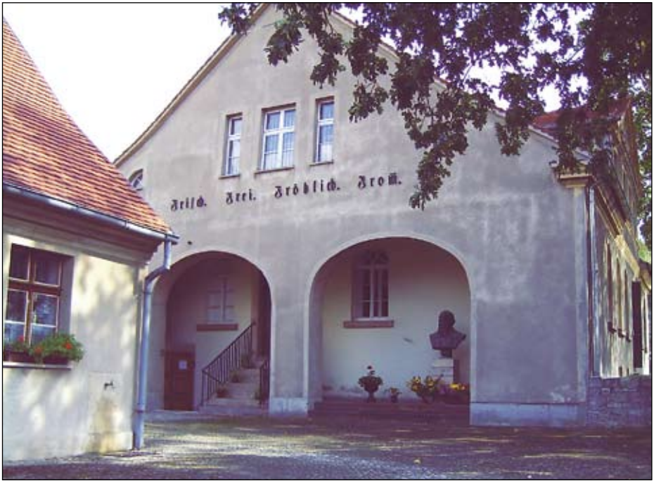
Jahn-Museum in Freyburg